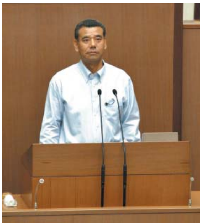
埼玉県議会本会議場にて

7月14日から8月4日にかけて開催された県議会6月定例会は、62億1,131万1千円の補正予算を可決し終了しました。