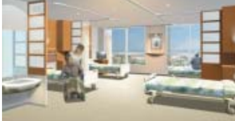
木材や和紙を使ったゆったり病室