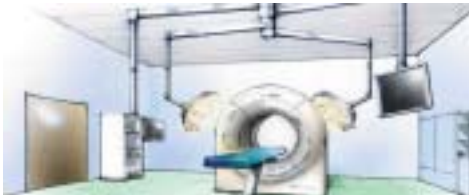
より多くの患者を救うハイブリッド手術室